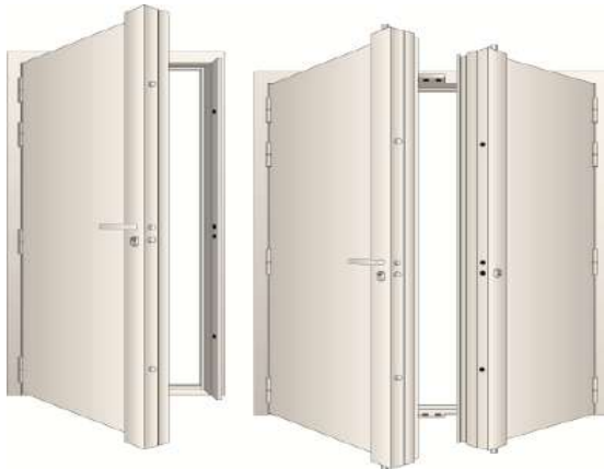
Serrure en Applique