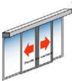
Avec ou sans partie latérale