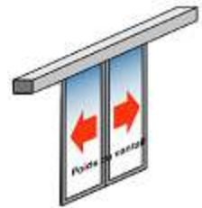
Sans partie latérale